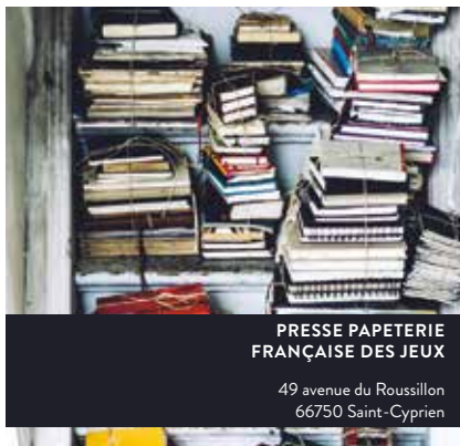
PRESSE PAPERIE FRANÇAISE DES JEUX

Presse - Librairie - Carterie Papeterie - Française des jeux