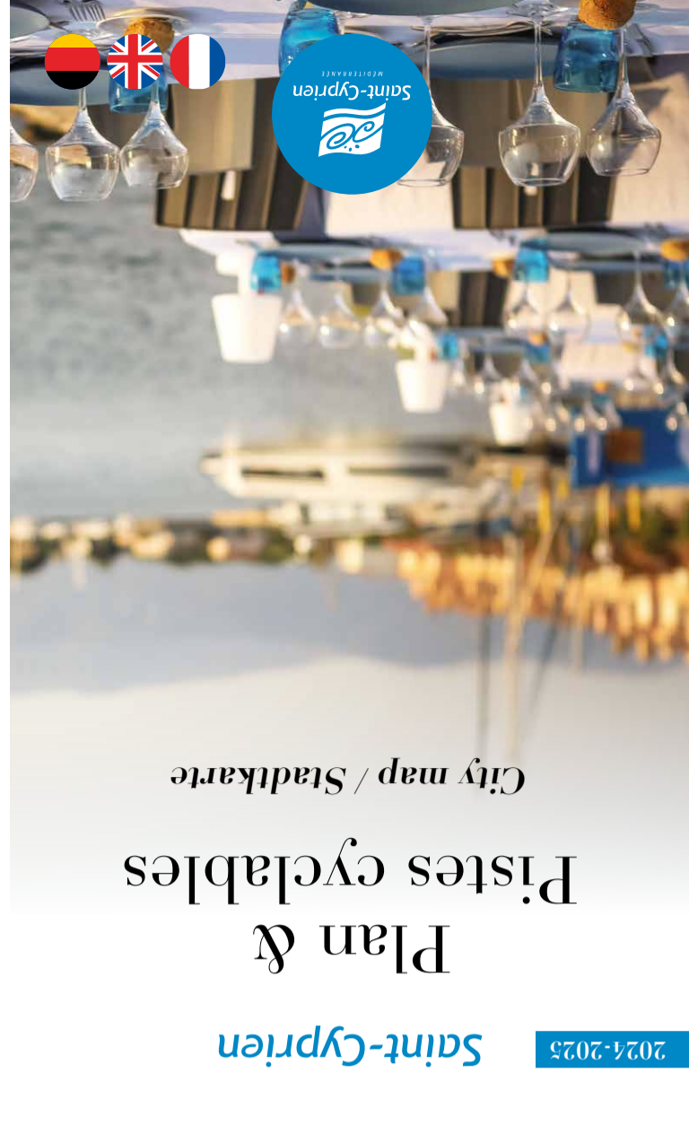
City map / Stadkarte