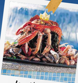
les spécialités méditerranéennes

Cap à Saint-Cyprien au bord de l'eau pour profiter pleinement de tous les bons plans proposés : activités aquatiques, dégustations, sorties, visites culturelles... Ces vacances sont parfaites pour nous et on va vivre de belles expériences !