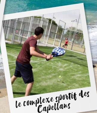
le complexe sportif des Capellans