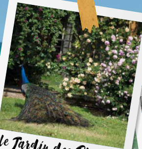
le Jardin des Plantes