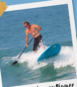
les activités nautiques